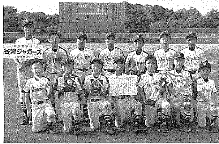
準優勝の谷津ジャガーズ