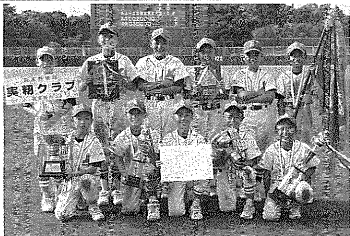
優勝の実初クラブ