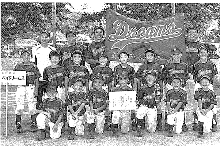
準優勝の習志野ペイドリームス