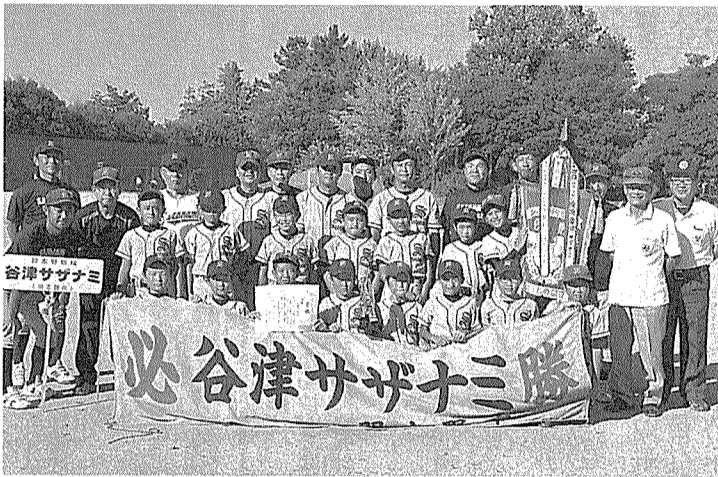
優勝の谷津サザナミ